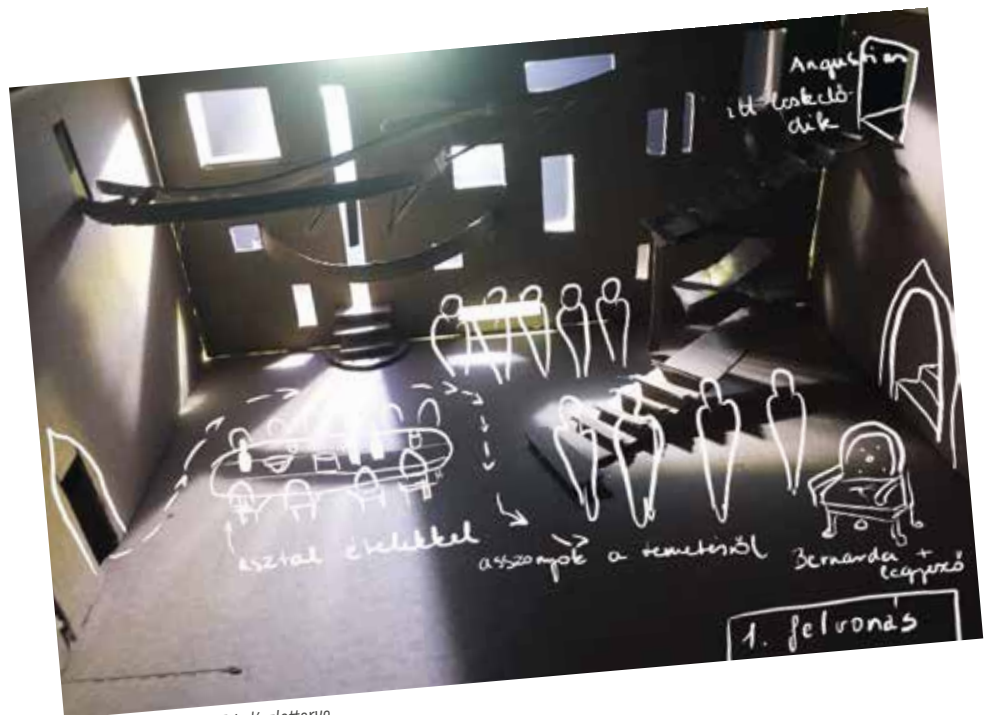
Takács Lejla Fanni MA I. díszletterve