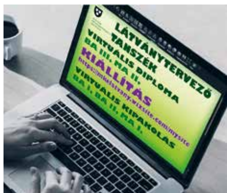
Az MKE Látványtervező Tanszékének virtuális kiállítása