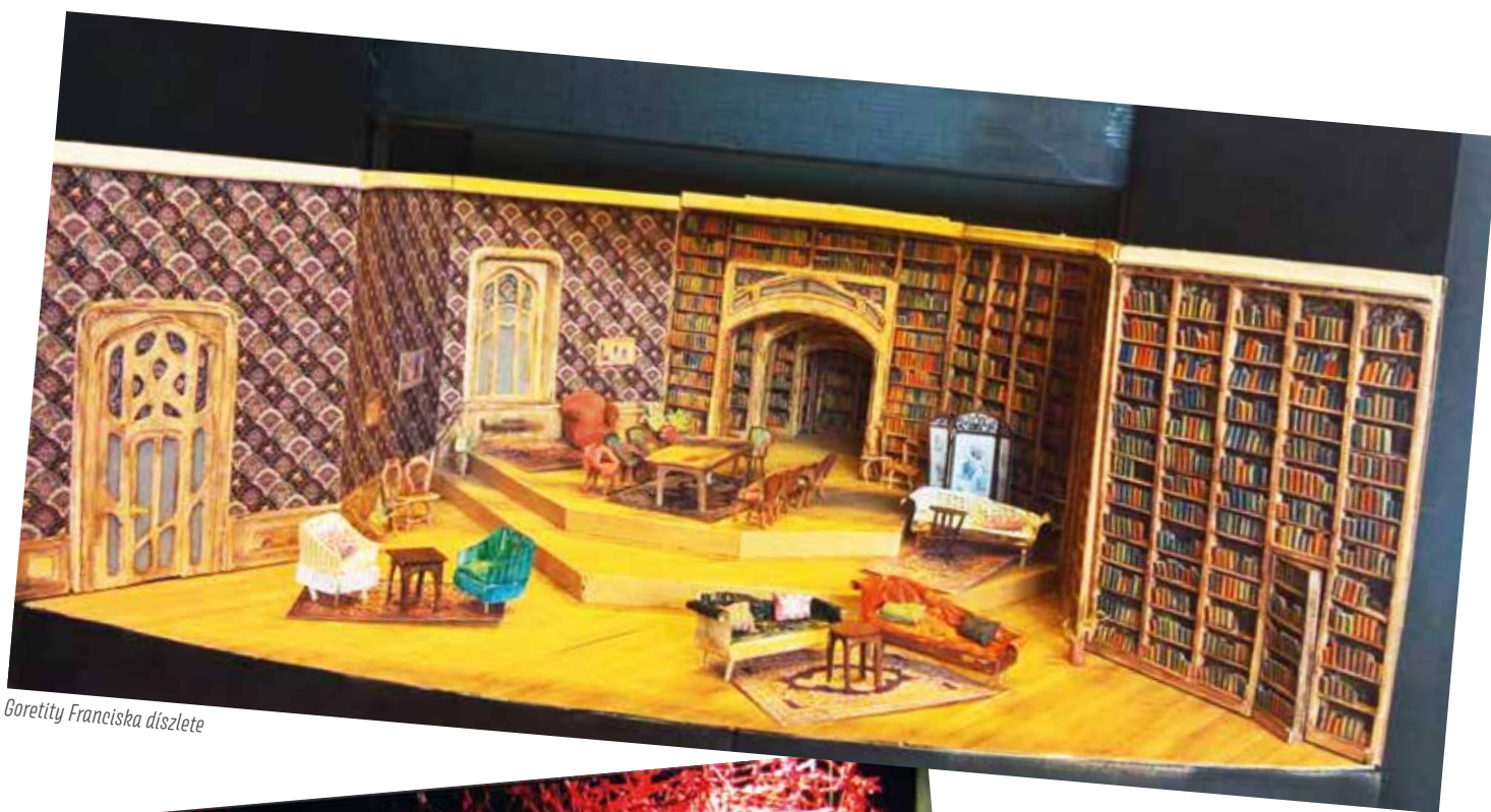
Goretity Franciska díszlete