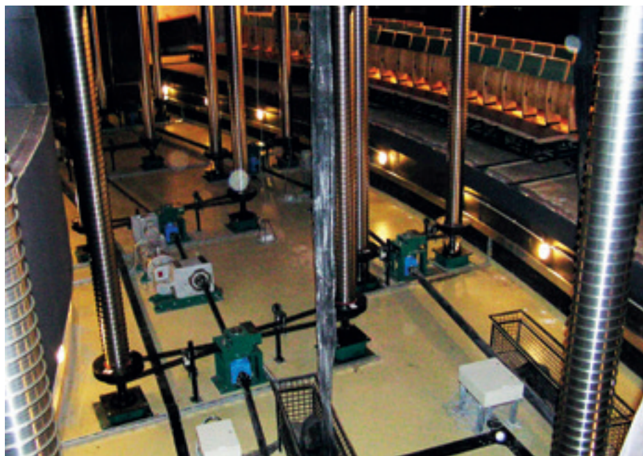
► Spirálliftes színpadi süllyedők