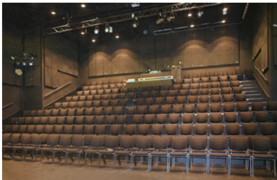
► A Drammens Teater stúdió