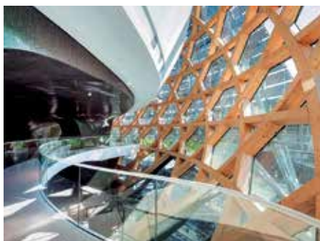
► Az előcsarnok és az áttört faburkolat