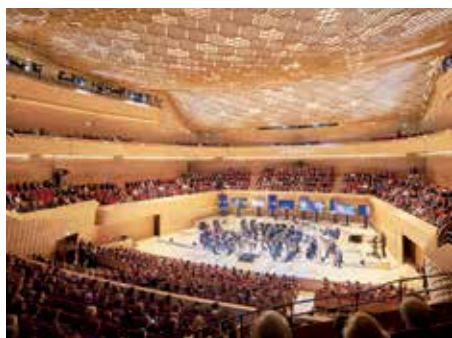
► A hangversenyterem