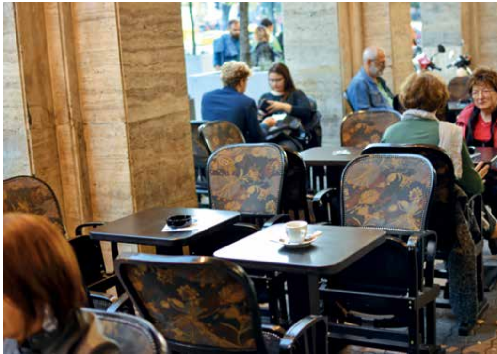
► A 23 éves székek most a színház kávéházában szolgálnak az árkádok alatt

kialakultak a jelenlegi útvonalak. A színpadtér a teherlift mellett egy előkészítő szakasszal bővült. Programozható ponthúzó, munkakarzatok épültek be. A tervezettségbe már magam is bekapcsolódtam, így született az országban először gyűrűs forgószínpad a nagy nehezen elindult, több részletre szétszakított felújítások alatt. A nézőtér légkondicionálást kapott, kibontották az erkély páholyait, helyettük három sor székekkel bővültünk. Az előcsarnok és a ruhatár többnyire a jelenlegi állapotot nyerte el, a vizesblokkok modernizálásával együtt. A szakaszos felújítás hátrányait leginkább a főbejárat szenvedte el. Kétszer is kárba vesztett a teljes szerkezete. Az elektromos hálózat felújítása is