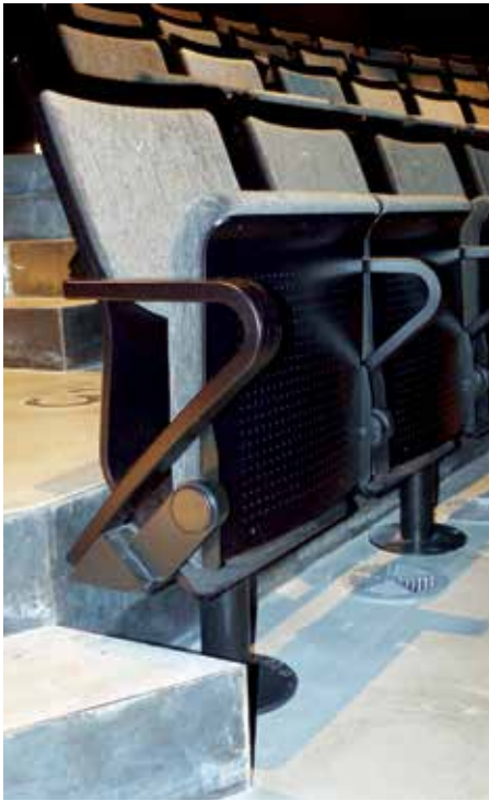
► Az új nézőtéri székek