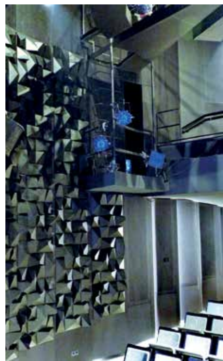
► Aprólékos gonddal kidolgozott, monokróm esztétika

zás előadása után, Mensáros László ötletére innen kísérte végig közönsége a művésznő hintóját, fátylászmenettel a városon át, a Fehérhajó utcába. Hofi Géza ezeken a kopott deszkákon énekelte éjszakánként, műsora csúcspontján, sok kemény társadalmi kritikát tartalmazó tréfa után a Kiöregedett vadászkutya szívbe markoló dalát. A technikailag, komfortjában és esztétikailag elfogadhatatlan körülmények ellenére a közönség kedvelte, sokszor ez a játszóhely tartotta el a körüli anyaszínházat is. A színpad alját csupán egy fődömlézés választotta el az előcsarnoktól, így a sugó csak négykézláb mászhatott a helyére; ha egy lakó lehúzta a WC-t, azt mindannyian hallgathattuk a nézőtérben. Díszleteinket a pincéből mindössze 30 cm széles, felnyitható csapdákon át, a ruhatáron keresztül, kötéllal húzták fel a műszakiak a nézőtérre, ott a falnak támasztva vagy a zöllye székeire fektetve várhattak a cserére. El lehet képzelni, hogy ez a munkafolyamat milyen sérüléseket okozott. A plasztikus elemek, bútorok a külső raktárból kézikocsin érkeztek a főbejárat elé, innen csak a közönségforgalmi útvonalon kerülhettek a színpad elé. Ellensúly