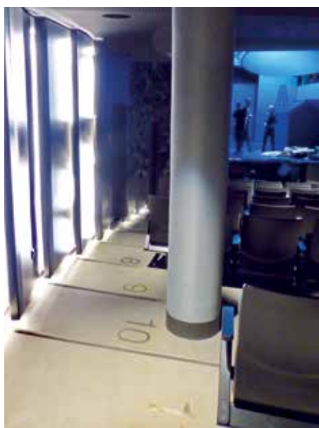
▶ Széksorunkat így könnyen megtaláljuk

szürke zoknival. De mi köze van ennek Balassi Bálinthoz vagy Csokonai Vitéz Mihályhoz? A híres kabarészöveg szerint: Megmagyarázni tudom, de nem értem! Hosszú ideig zavar ez a művek befogadásában, holott ilyen fantasztikus verszuhatagban csak egyszer, több mint ötven éve volt részem az Egyetemi Színpadon, Mensáros László XX. század előadójánál.