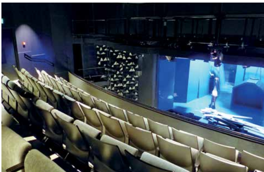
▶ Erkély és az oldalfalába süllyesztett kapaszkodó