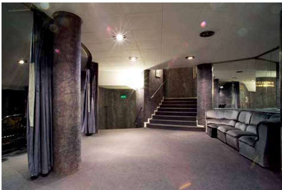
► Pihenő bővülete a lépcsőházak találkozásánál

A készülő átépítésről furcsa elképzelések terjedtek, úgy hírezték, radikális változás lesz, színpad és nézőtér helyet cserél. Nem így történt, de sok minden módosult. A nézőtér most is két szakaszra oszlott, az erkély viszont jóval előrébb nyúlik, mindenütt kényelmes a sortávolság. A jobb látási szögek érdekében a földszintet hátul megemelték, mögéjük fény- és hangvezérlő helyiségek kerültek. Ennek következtében le kellett mondani arról a széles folyosószakasrról, amely eddig a közönség áramlását segítette →