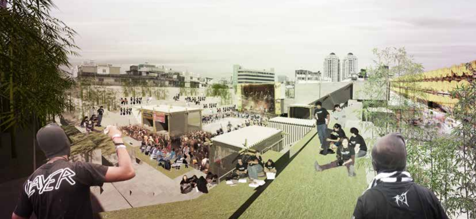
► 1. díj: Zenélés a Ye-Tai-n

alakít ki, közös hátsó színpaddal, továbbá szolgáltató és ételt, italt, egyéb cikkeket árusító kisebb pavilonokat. A pavilonok moduláris felépítésű bambusz vázszerkezettel készülnek, amit acél hullámlemez és szélvédő háló borít, a szükséges helyeken áttörésekkel. A stadion meglévő lépcsőit ülőhelyként használítja, ahonnan jól láthatók a szabadtéri színpadok, illetve részben bambusszal ülteti be, hogy megtörje az egyhangúságukat és finomabbá tegye a látványukat. A rajzok világosan kifejezik a tervezési koncepciót, és kiválóan közvetítik a megteremtett kötetlen fesztiválhangulatot. Nagy érzékenységgel és stílusérzékkel megvalósított egyszerű terv.