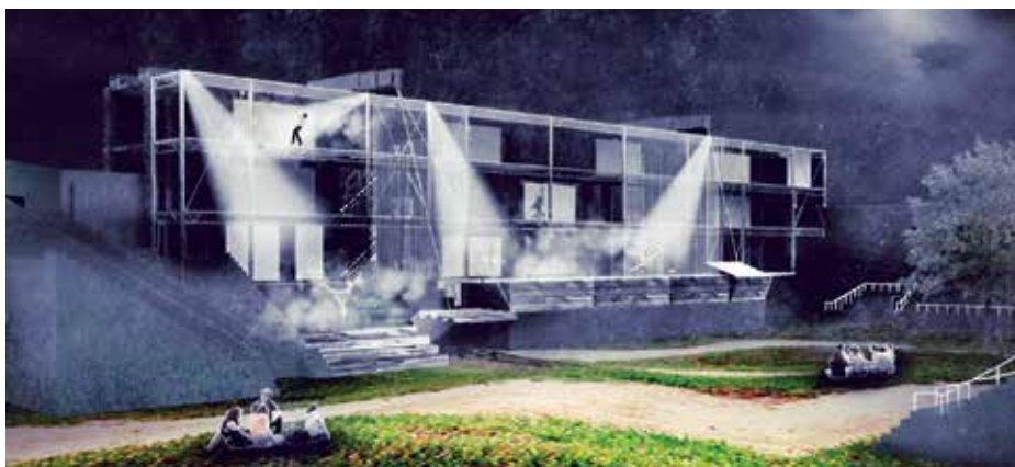
► 577704 sz. pályamű: Várák a levegőben

A terv egyetlen gesztus, ami a stadion alapszintjéről induló, felfelé keskenyedő, többemeletes lépcsőt helyez a stadion távoli végére, ami legfeljül túllép a stadiont körülvevő falon. A lépcső használható színpadként, de az előadástól függően nézőtéri ülésként is, alatta pedig több szinten a nézőket kiszolgáló létesítmények, öltözők és egy stúdiószínház található. A rendkívüli egyszerűség erősen teátrális megfogalmazása, rugalmas és többértelmű, de talán inkább színpad, mint építészeti munka.