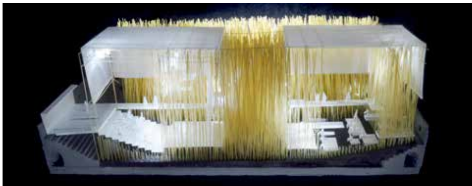
► 843800 sz. pályamű: Növésben lévő bambuszsínház

MA Dipl. Arch. építész Foster Wilson Architects