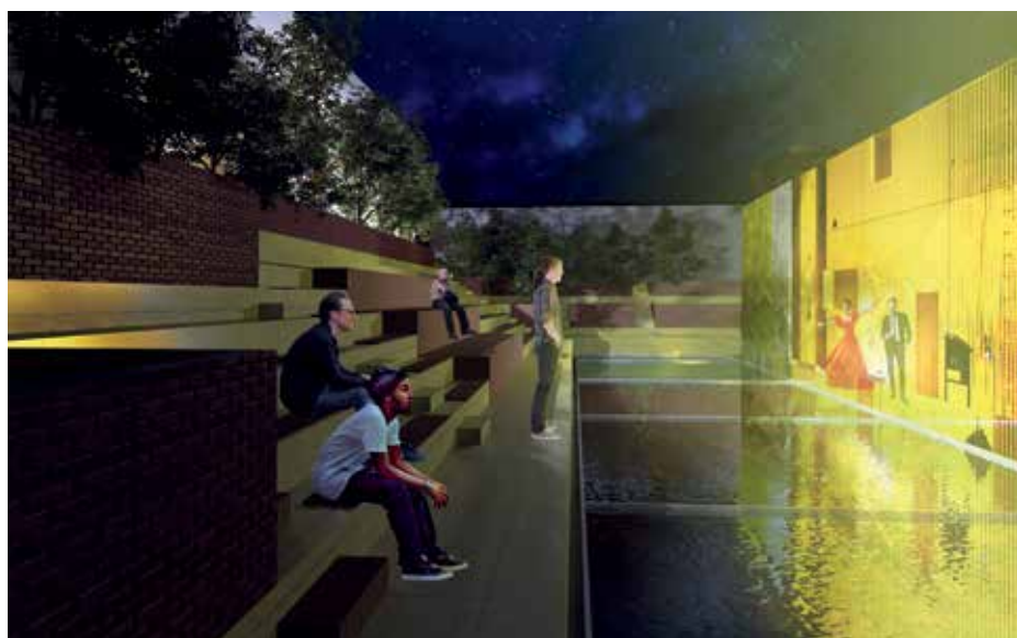
► 2. díj: A színház mint közösségi tér

vesz körül. A központi tér fennmaradó részét közösségi térré alakítja, olyan érkezési helyé, ahol a stadion meglévő nézőtéri soraiból meg-