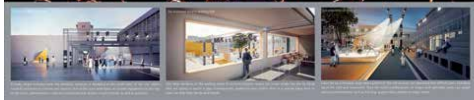
► 3. díj: Történetek nyomában

letet tartalmazó, nagyon jól kidolgozott terv, néhány kitűnő képi megoldással. A helyszín belépési oldalán állandó épületet tervez, ez a megérkezés helye, előcsarnok és 100 férőhelyes, sarokszínpaddal és hátsó járásokkal kiegészített, zárt színháztér. A szemközti oldalon elhelyezett, 200 férőhellyel rendelkező szabadtéri színház sík padlón, a fölötte lévő stadionlépcsőkön kialakított lelátódobogókön várja közönségét. A szemközti oldal hosszában elhelyezett, motorizált mozgó színpadok a teljes térben tudnak mozogni, az előadás né-