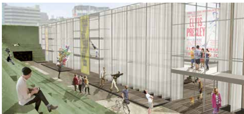
► 820702 sz. pályamű: Képzelt közösségi emlékek felidézésének csarnoka

letet tartalmazó, nagyon jól kidolgozott terv, néhány kitűnő képi megoldással. A helyszín belépési oldalán állandó épületet tervez, ez a megérkezés helye, előcsarnok és 100 férőhelyes, sarokszínpaddal és hátsó járásokkal kiegészített, zárt színháztér. A szemközti oldalon elhelyezett, 200 férőhellyel rendelkező szabadtéri színház sík padlón, a fölötte lévő stadionlépcsőkön kialakított lelátódobogókön várja közönségét. A szemközti oldal hosszában elhelyezett, motorizált mozgó színpadok a teljes térben tudnak mozogni, az előadás né-