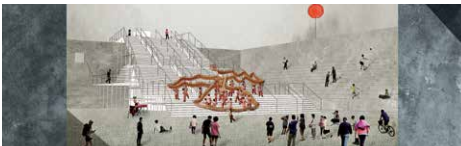
► 312228 sz. pályamű: Lépcsős színház

A stadion teljes küzdőtere rendkívül gyors növekedésű, erős bambusszal van beültetve. Minden egyes előadáshoz különböző környezeteket lehet kihásvítani a bambuszerdőből, legyen az ösvény, terem vagy színpad, mindegyik belátható a körben lévő teraszokról. A bambusz gyorsan visszánő, hogy készen álljon a következő előadásnak megfelelő új konfiguráció kialakítására. Természetes anyagot használó, gyönyörűen bemutatott, ötletes koncepció, költői és teátrális.