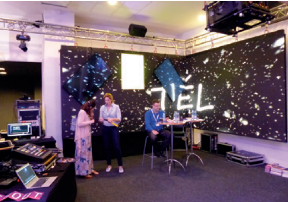
► Mikropo Vizuáltechnika Kft. standja