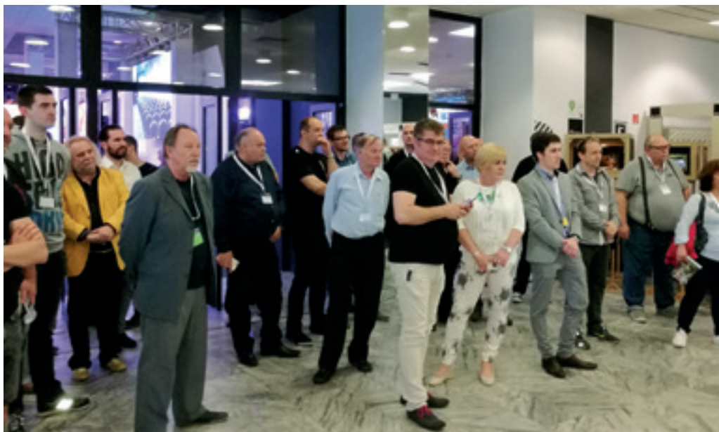
► A megnyitó közönsége

es és 1980-as évekhez köthető látványterveiből válogatva jött létre. 1