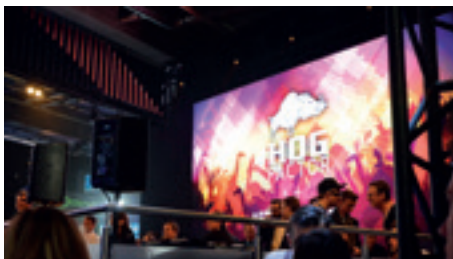
► A High End Systems standjának részlete

Ha már szóba került a fény, következzen a prémiumgyártó, a High End Systems standjának bemutatása. A legnagyobb szenzáció a nemrég megjelent SolaTheatre volt, amely a világ első ventilátor nélküli, nagy teljesítményű LED-es fényforrással ellátott robotlámpája. Ezt az eszközt részletesen is bemutatjuk a lap Technikai újdonságok rovatában. A standon elképesztő mennyiségű lámpa került elhelyezésre, melyek előre programozott koreográfiát követtek, vigyázva, hogy mozgásuk és fényük