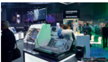
► A Luminex standja Frankfurtban

ne legyen zavaró a stand látogatói számára. Rengeteg fénypult állt rendelkezésre, hogy az érdeklődők egy nagyméretű kijelző és a Light Converse program segítségével egy igazi nagyszínpadon gyakorolják a színpadi lámpák vezérlését, illetve a High End Systems szakembereinek segítségével elsajátítsanak néhány szakmai trükköt. Szintén a kiállításon jelentettek be a legújabb HOGFactor verseny győzteseit is. A verseny lényege, hogy az induló csapatoknak egy meghatározott zenei alapra kell fényshow-t készíteniük, az elkészült munkákat pedig egy szakmai zsűri értékeli. A legjobb három munka bemutatásra került a kiállításon megrendezett VIP partyn, illetve az értékes nyeremények átadása is itt történt meg.