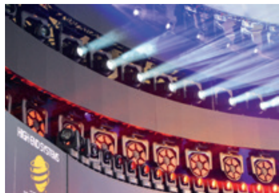
► High End Systems lámpák Frankfurtban

Az amerikai Crestron vállalat is részt vett a kiállításon, mely a világ szinte valamennyi kontinensén és legfontosabb országaiban jelen van. Fő profilja az intelligens vezérlőrendszerek, valamint az otthonautomatizálás. A standjukon bemutatott eszközök egy részét működés közben is kipróbálhatták az érdeklődők.