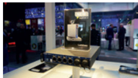
► Luminex GigaCore 10 switch

A felsorolt gyártók standjain készített fotóinkat az INTERTON Group Facebook-oldalán tekinthetik meg ( facebook.com/interton.kft ).