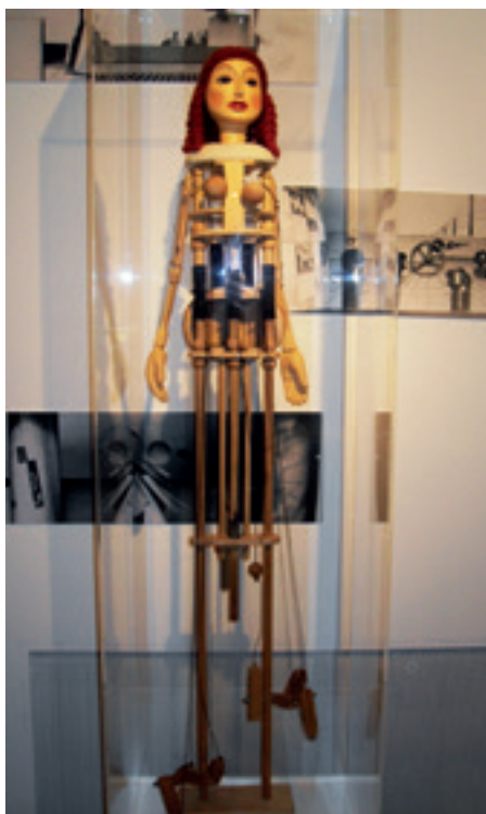
► Billentyűs marionettbáb rekonstrukciója, Lellei Pál 2007