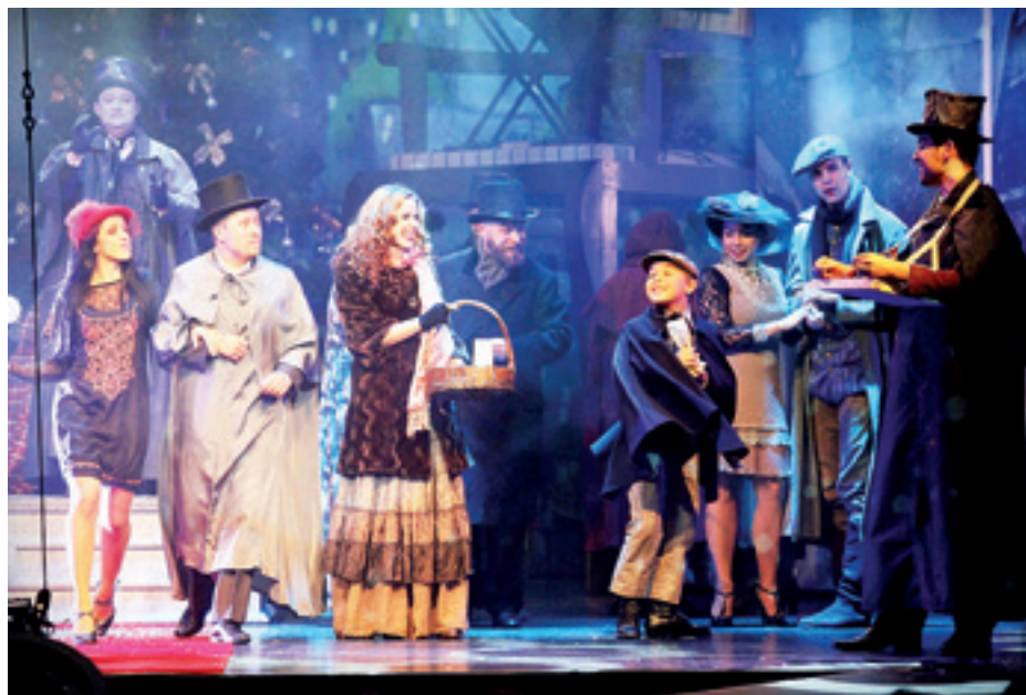
▶ A gála fináléja: jelenet a Diótörő és Egérkirály musicalből