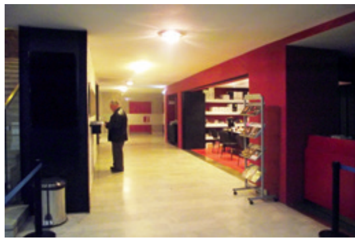
► Centrál Színház portál és szervezés

→ Hasonló megoldást alakított ki a Játékszín . A körút felőli főbejáratot átalakították, a zárt pénztárfülke elbontásával megnövelt térben nyitott pult mögé ült a pénztáros. Így közvetlenebb a kapcsolata a vásárlókkal. A színház hátsó bejáratánál, a Jókai utcában „Művészbejáró” néven presszót alakítottak ki, amely az előadások alatt büféként üzemel.