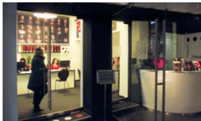
► Örkény Színház pénztár és szervezés

Az Erkel Színház földszinti előcsarnokába nyolc darab mobil pult került, a falak festéséhez igazodó színekben, csikos és fekete-fehér kockás mintával. A színház művészbüféje is megújult.