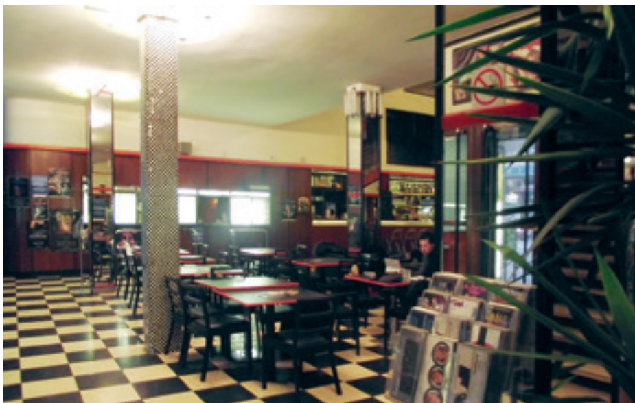
► Átrium Film-Színház előcsarnok

Másfajta próbálkozások is vannak a színházak részéről a közönségkapcsolatok nyitottabbá tételére. Ma már nem elégedhetnek