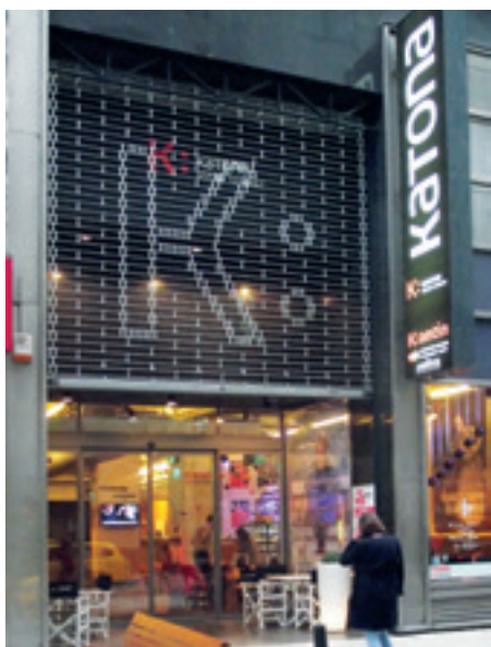
► Katona József Színház bejárat, ruhatár, Kantine