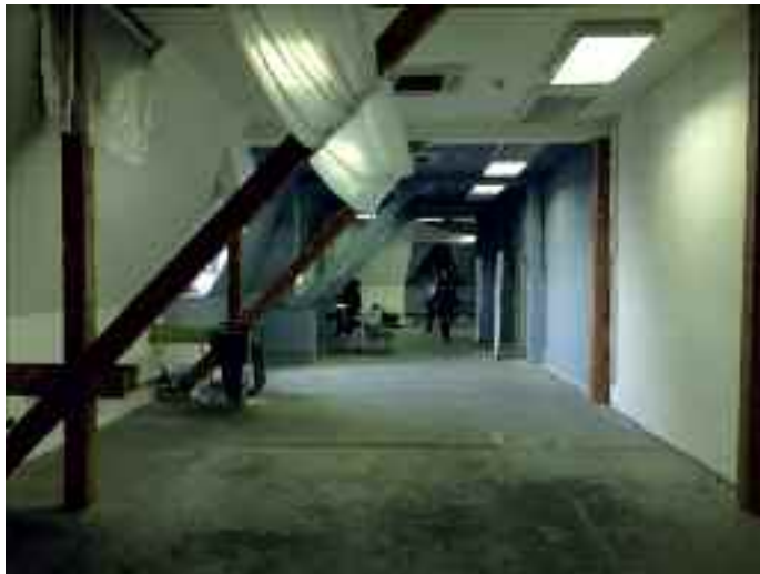
Franz Kafka szülőháza

emberek megosztják gondolataikat és társadalmi felelősségüket is. A színpadi látványtervezés, az előadás térbeli összefüggései éppúgy kiemelt figyelmet kapnak, mint a különféle szellemi vonatkozások – a narratívát, a szociális jelentőséget, a jelen és a múlt síkjait beleértve.