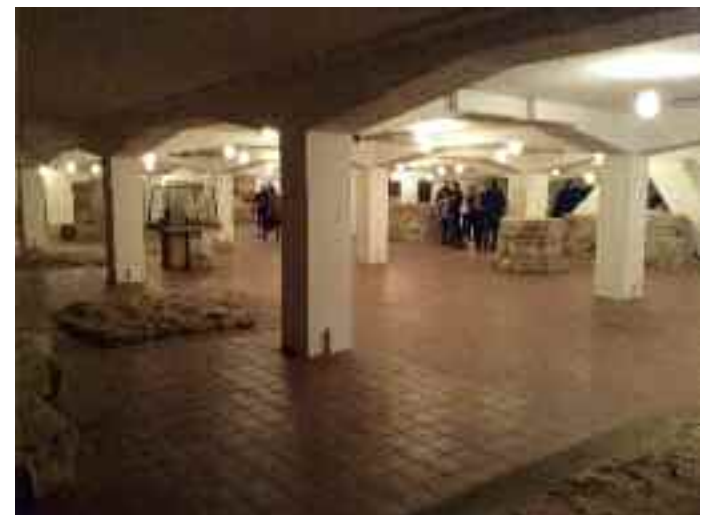
Lapidárium a Betlehem-kápolnában