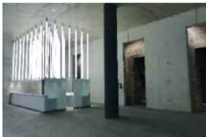
Büfé az előcsarnokban