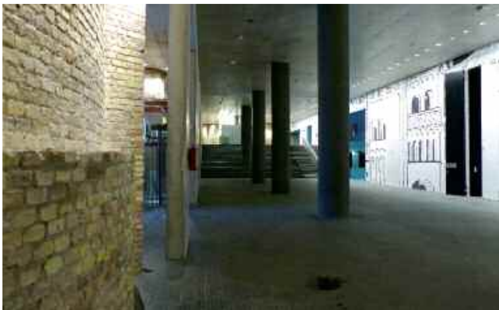
Rendezvényterem impozáns előcsarnoka

A teheremelő mozgatása hidraulikus, 35 kW teljesítményű, vezérlése: csak külső, hívó-küldő vezérlés. A felvonó mindhárom szintjén 1 óra tűzállóságú, 3,3 x 2,8 m mé-