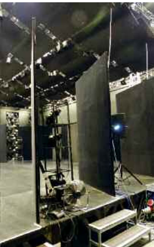
Színpad a Táncszínház eszközeivel