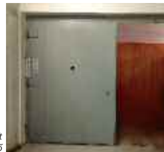
A díszletszállít emelő

Az oldalfalba teljesen behúzható ülőssorok