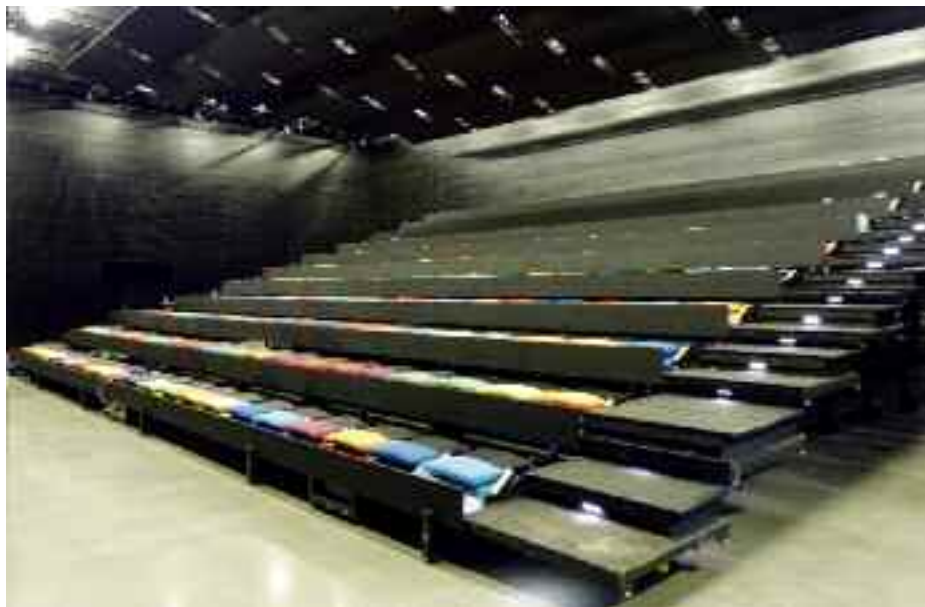
Kisterem: tribün kihúzva, ülések háttámlája lehajtva

A rasztercsomópontokban a csőtartó hasznos teherbírása 750 kg. A csőtartók és az álmennyezet közötti légréteg 150 mm, részben az általános rendeltetésű huzalozások, másrészt a díszlethúzó kötelei, vezetékjei részére. >