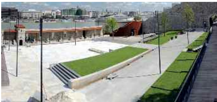
Az Öntőház udvar szabadtéri rendezvények helyszíne lesz