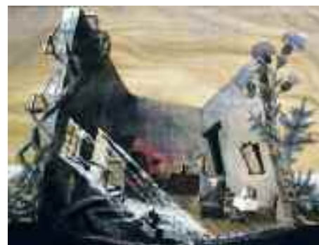
Ugo Betti: Bűntény a Kecskeszigeten – díszletterv vázlat

A két színházvezetőnek ahhoz is volt bátorsága, hogy a színházhoz szerződtesék Latinovits Zoltánt, ráadásul itt debütálhatott mint rendező Németh László Győzelem című darabjával. Ugyancsak ebben az időben jelent meg a Veszprémi Nyomda közreműködésével Latinovits Ködszurkáló című könyve,