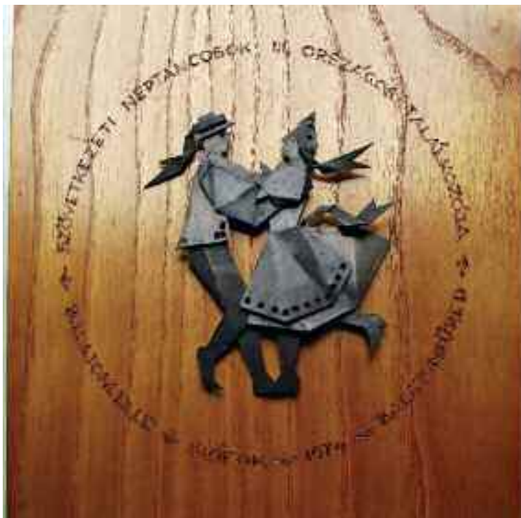
Alkalmi emléktárgyak készítése