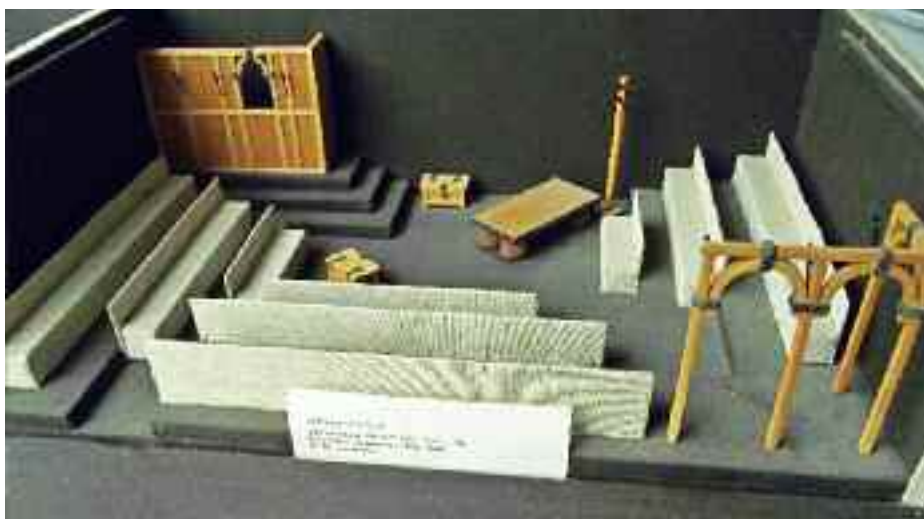
Rómeó és Júlia makett (Budapesti Gyermekszínház Stúdiószínpada, 1983)