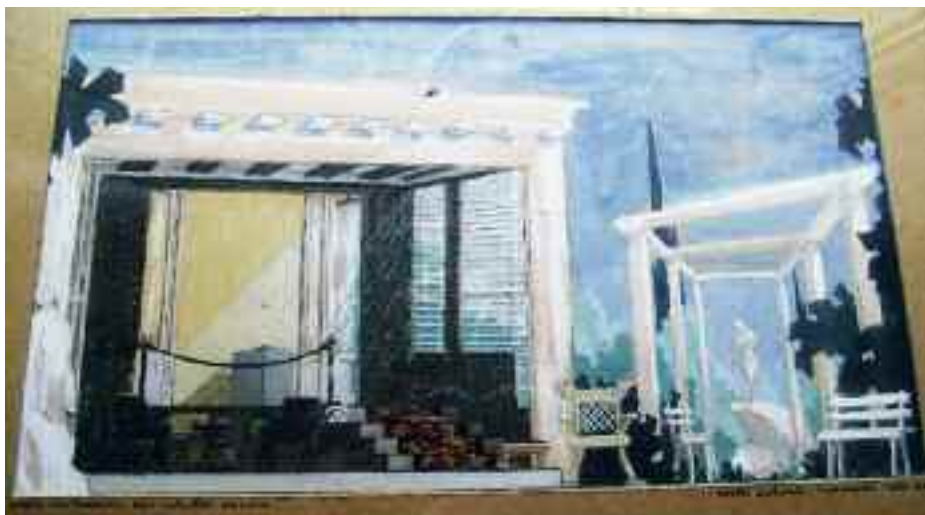
Horia Lovinescu: Egy művész halála (Veszprémi Petőfi Színház, 1963)

A MÁV Szimfonikus Zenekar szálló-vonat-szerelvényen utazott velünk, ők szolgáltatták a hajón, a megmagasított színpadtér előtt, az előadáshoz Mendelssohn kísérőzenéjét.