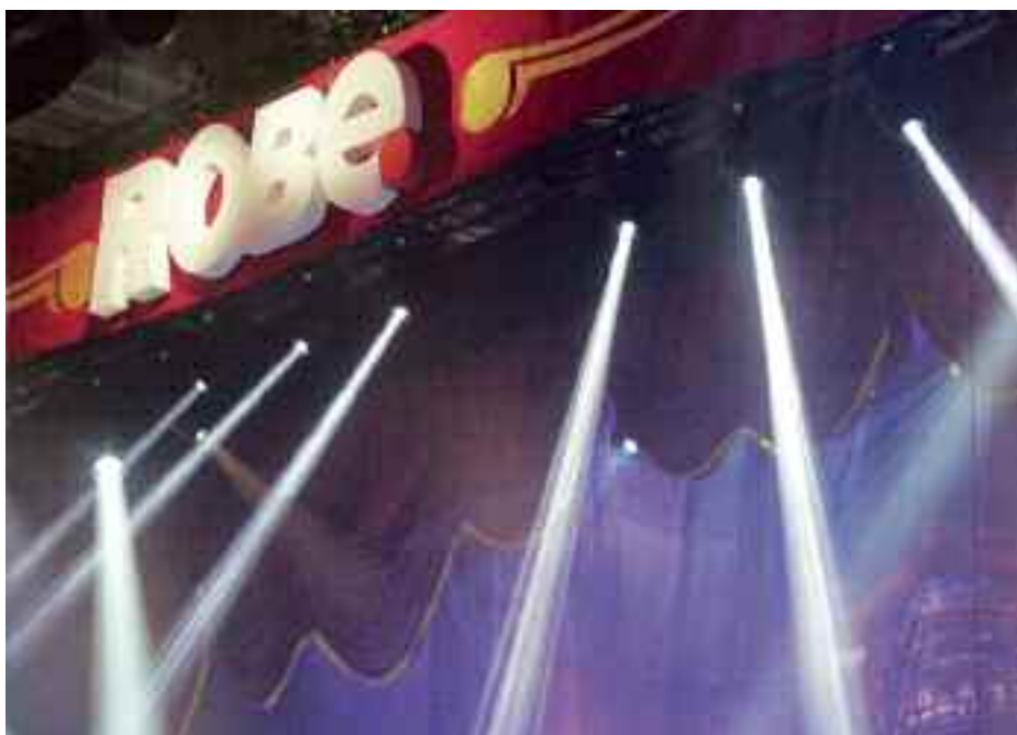
Színház ROBE módra

Az olasz LDR standján a kitűnő kávé mellett a ma már hat tagból álló LED-es ALBA fantázianevű fényvetőiket tesztelhetjük, melyeket 200 W-os LED-fényforrással szállítanak.