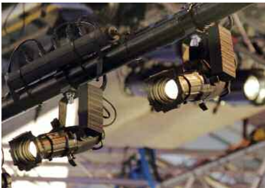
ETC – Source Four Mini, hihetetlen, de a tenyerünkben elfér!

A német JB Lighting standján két újdonságot fedezhettünk fel, az új A6 -os típusú kompakt, kisméretű mozgófejes LED-fényvetőt, és az igen nagy, 800 W-os LED-teljesítményű Varyscan P8 típusjelzésű mozgófejes profilgéppüket.