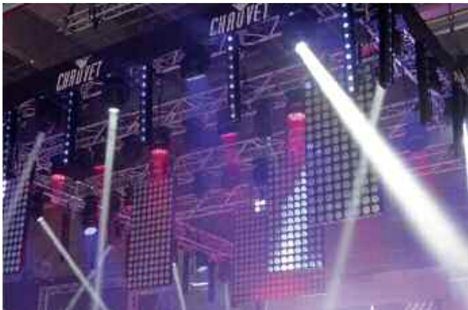
Chauvet – az egyik amerikai nagyker-óriás

A Clay Paky a megszokott elegáns standján mutatta be az immár igen széles palettájú LED-es és kompakt fémhalogén fényforrású effektarzenálját. Itt mutatták be a Sharp 330 Wash mozgófejes gépüket, mely 330 W-os fémhalogén fényforrásra épül, és kompakt