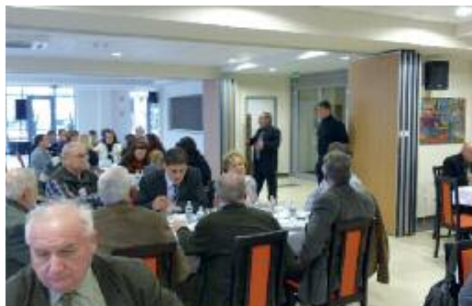
Az étterem behúzható válaszfalakkal kisebb termekre tagolható