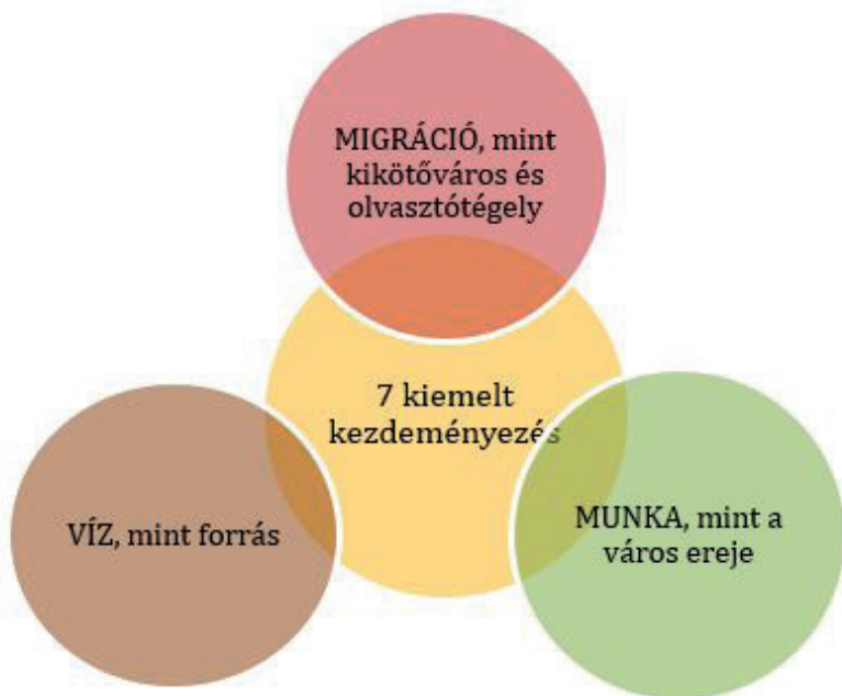
3. ábra: A Rijeka 2020 pályázat központi koncepciója

A szakemberek a helyi lakosság bevonását, a közösségek szerepének hangsúlyozását a projekt kialakítás kezdetétől egészen a megvalósításig lényegesnek tartják. Az önkéntesség, a civil ötletek mellett egyértelművé vált, hogy a helyiek azokat a fejlesztéseket, programokat fogják a jö-