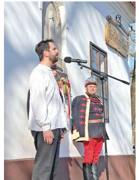
Ács Tamás színművész