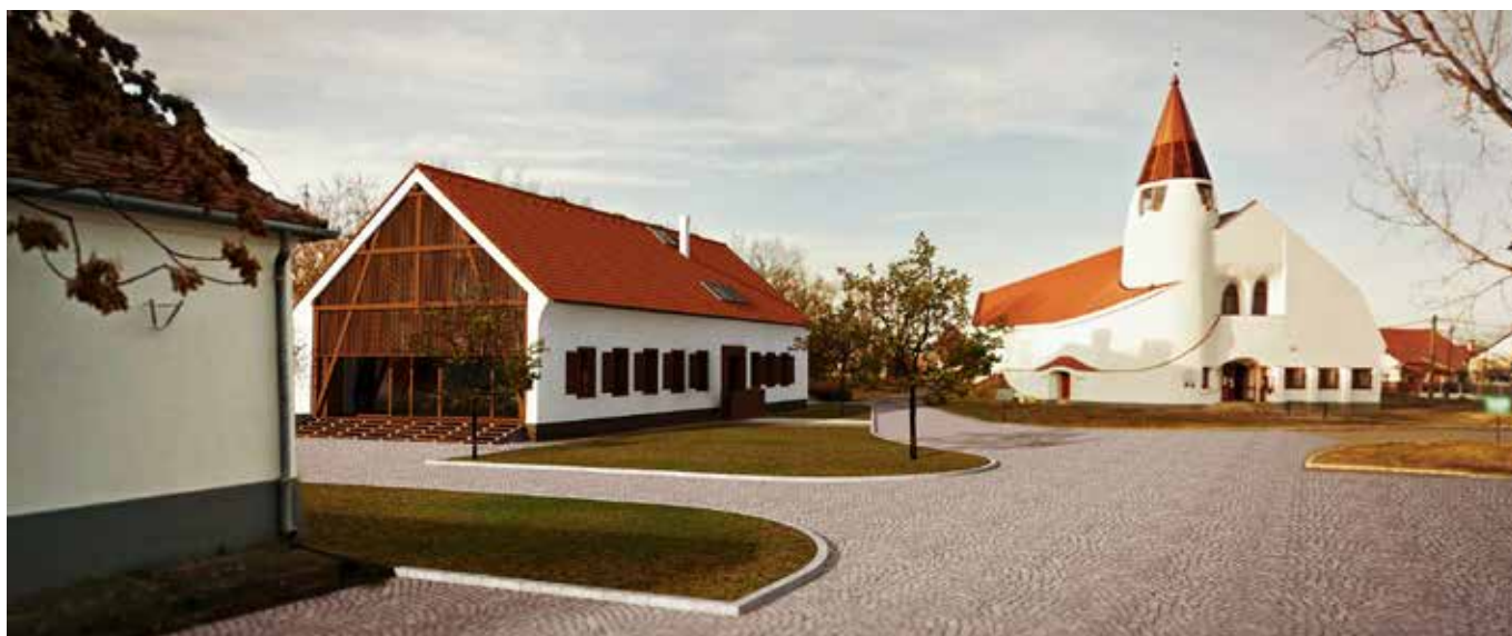
A Kulturális Centrum (Vendéghodály) látványterve