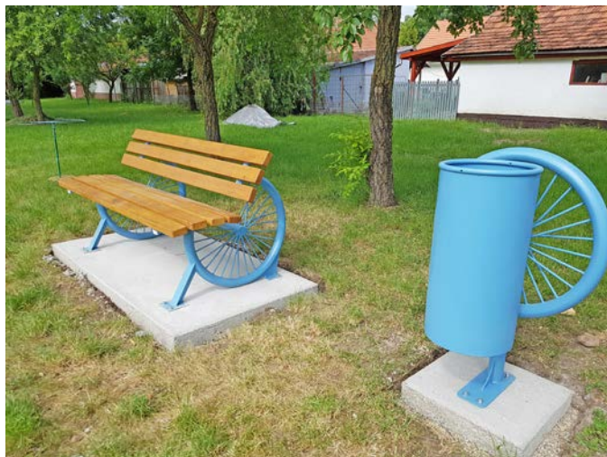
Pihenőpad és hulladéktároló