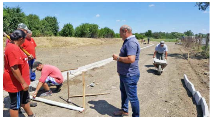
Készül a parkoló