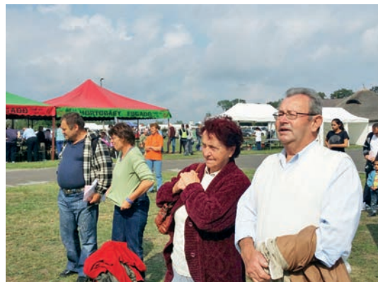
Szeptember 12-én Hortobágyon tartották a Nagycsaládosok Országos Szövetségének őszi országos találkozóját. A rendezvényen változatos programok várták az ország minden részéről érkező családokat. A szép őszi napon sok Hortobágyi is kilátogatott a találkozóra.