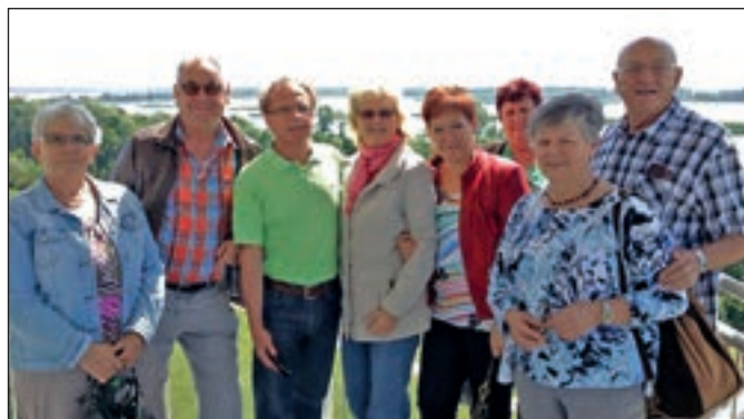
A német vendégek a poroszlói Ökocentrumban