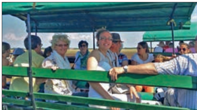
A küldöttség látogatása a Pusztán