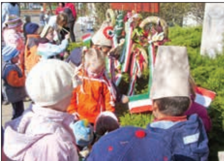
Koszorúzás március idusában