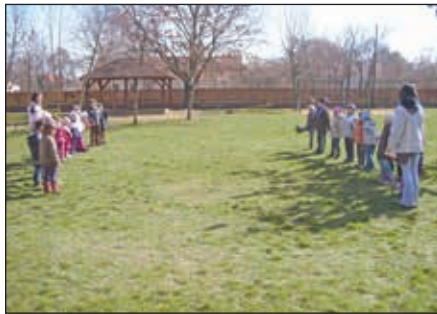
Adj király katonát! – huszárosan

Hortobágy Község Önkormányzata 2014. május 31-én, szombaton várja a településünk lakóit a Hortobágyi Falunapra. A reggeli felvonulást – amely mint minden évben a Titi Éva Faluháztól indul – ünnepélyes megnyitó, majd az óvodások és az iskolások fellépése követi. A főzőverseny már a reggeli helyfoglalást követően elindul, de a zsűri csak délben fog az ízléshez.