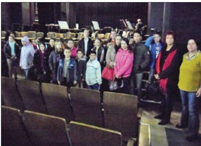
A Kodály Filharmonikusok koncertjén résztvevők