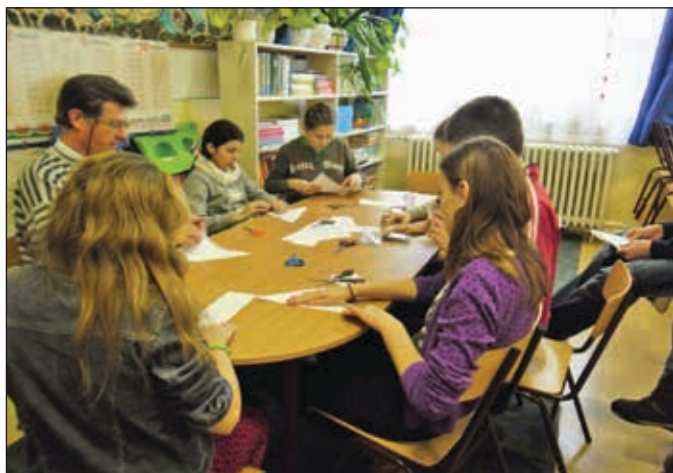
„Egészségesen, értékeink megőrzéséért” TÁMOP 3.3.14.A-12/1 pályázat egyik foglalkozása