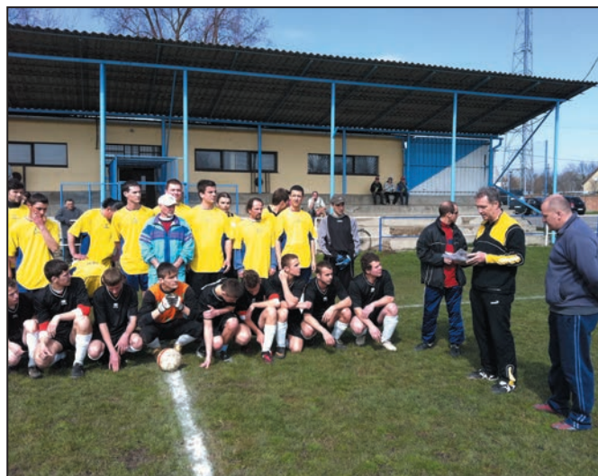
A mérkőzés megkezdése előtt a csapat átadta a dorogi vezetőknek a hortobágyi CHROME RT rock együttes aranylemezének 10 db másolatát

03.27. Hajdúdorog 04.02. Józsa 04.10. Hajdúhadház 04.16. Monostorpályi 04.24. Nádudvar 05.01. Vámospercs 05.08. Fülöp 05.15. Sáránd 05.21. Józsa SE