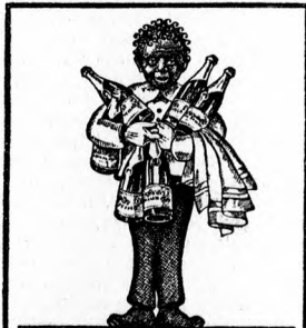
A. MALÁTA-PEZSGÓ-SÖR HOGYHA MINDIG ISSZA EGÉSZSÉGÉT S PÉNZT EGYRÉSZÉT JUTALOMKÉNT KÁRJA VISSZA. GYÁRTJA A FŐVÁROSI SÖRÖZŐ R.T. KÖZBÁNÁR.

Az amerikai útlevel ára — hat dollár. A budapesti amerikai konzulátus közli: Az új amerikai törvény öt dollárban szabja meg az amerikai útlevelek kiállításáért fizetendő illetéket, a korábbi kilenc dollár helyett. A kérvényezési illeték egy dollár marad és így az útlevelek kiállításának összköltsége tíz dollárról hat dollárra csökkent. Az útlevelek érvényessége két év és további két alkalommal meghosszabbíthatók két-két évre, vagyis az útlevel összesen legfeljebb hat évig lehet érvényes. A kiterjesztések illetéke két dollár. A kiterjesztés azonban csak olyan útleveleknél lehetséges, amelyek 1928 július 1-én, vagy később lettek kiállítva.