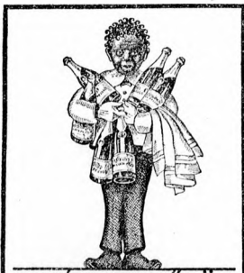
A MALATA-PEZSGŐ-SÖR HOGYHA MINDIG ISSZA EGÉSZSÉGET S PENZE EGYRÉSZEÉT JUTALOMKÉNT KAPJA VISSZA GYARTJA A FŐVÁROSI SÖRFŐZŐ RT. KÖBÁNYÁN

Kitűnő francia pezsgősüret. Mig Franciaország déli vidékein az áríz okozott rengeteg pusztulást, addig az ország északkeleti részén, a Champagne-ban, a természet gazdag szürettel kedveskedett. A mult évi szüret ugyanis nem kevesebb, mint 80 millió palack pezsgősüret eredményezett. Egy negyedszázad óta ez volt a leggazdagabb és minőségben ez a legjobb pezsgősüret. Kérdés azonban, hogy meghozza-e ez Franciaországnak azt a 3 vagy 4 milliárd frankot, amit a pezsgő exportjából remélnék? Aligha, mert a francia pezsgők ma sokkal nehezebben adódnak el, mint ezelőtt. Ennek több oka van: mindenekelőtt a nagy eszégényedés, aztán a szesztilalmak, valamint egyáltalán a szeszitaloktól való tartózkodás, amely a sport terjedésével mindinkább növekszik. Oroszország korábban nagy fogyasztója volt a francia pezsgőknek, de most kiesett a bevós sorából. Ha még a magas vámakat és a különleges borítal- és pezsgőadókat vesszük számba, úgy nyilvánvaló, hogy a franciáknak nehéz dolguk lesz, ennyi pezsgőt eladni.