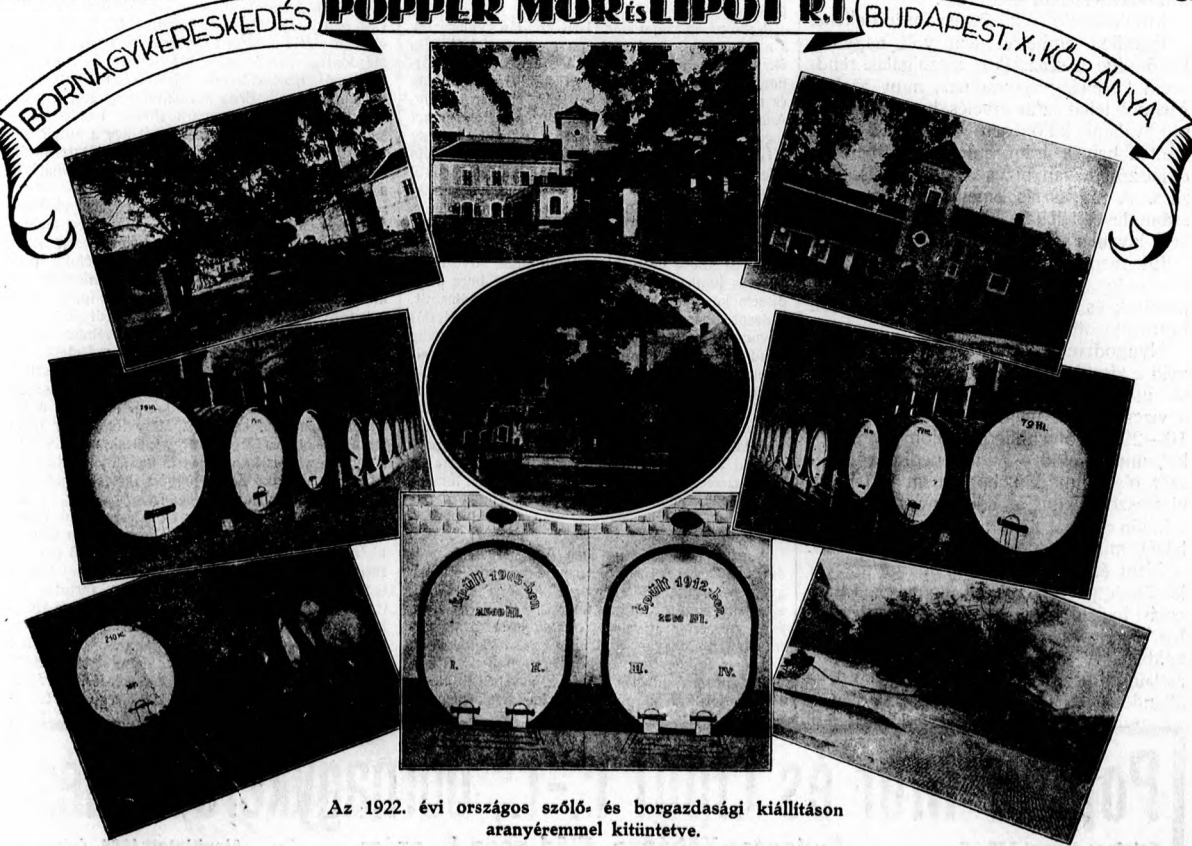
Az 1922. évi országos szőlő- és borgazdasági kiállításon aranyéremmel kitüntetve.