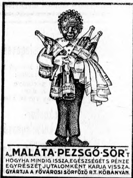
A. MALÁTA-PEZSGŐ-SÖR HOGYHA MINDIG ISSZA EGÉSZSÉGET S PÉNZT EGYRÉSZEZET JUTALOMKÉNT KAPJA VISSZA. GYÁRTJA A FŐVÁROSI SÖRFŐZŐ R.T. KÖBÁNYÁN