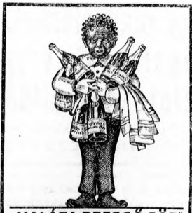
A. MALÁTA-PEZSGŐ-SÖR HOGYNA MINDIG ISSZA EGÉSZSÉGET ÉS PÉNTÉ EGYRÉSÉT JUTALOMKÉNT KAPJA VISSZA GYÁRJÁRA A FŐVÁROSI SÖRFŐZŐ R.T. KÖBÁNYÁN