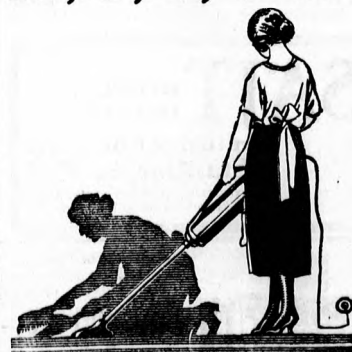
A takarítás hajdan és most!

Érdeklődésnél szíveskedjék lapunkra bivatkozni.