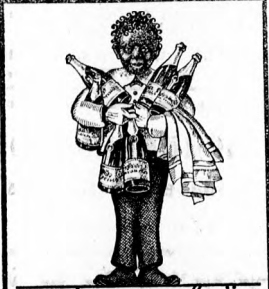
A. MALÁTA-PEZSGÓ-SÖR HOGYHA MINDIG ISSZA EGÉSZSÉGÉT S PÉNZE EGYRÉSZÉT JUTALOMKÉNT KARJA VISSZA. GYÁRTJA A FŐVÁROSI SÖRFŐZŐ RT. KÖBÁRYAN

borkereskedőt Budapest, VIII., Práter-u. 10. ahol legjobb megelégedésre lesz kiszolgálva