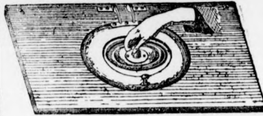
Új-féska klosot és nyílt árnyékszékék részére.