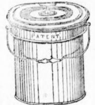
Szoba-klosot védőár alakban.

Budapestben, nagydífa-utca 14. sz. alatt. Képes árjegyzékek bérmentve küldetnek. Elárulitók keresztetnek.