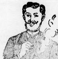
Egger-mellpasztilla csak-hamar meggyógyít!

az étvágyat nem rontják és kitűnő ízűek.