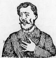
Megfojt ez az átkozott köhögés.

és elnyálokadás ellen gyors és biztos hatásúak