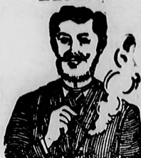
Egger-mellpasztilla csak hamar meggyógyít!