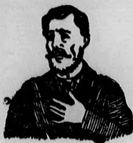
Megfojt ez az átkozott köhögés.

és elnyájkodás ellen gyors és biztos hatásúak