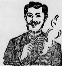
Egger-mellpasztilla csak-hamar meggyógyít!