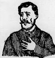
Megfojt ez az átkozott köhögés.

és elnyálkodás ellen gyors és biztos hatásúak