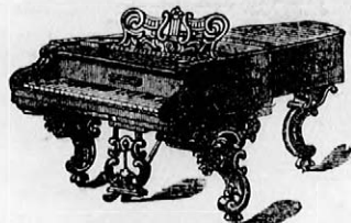
Jótállás 5—10 évre.