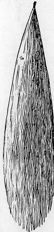
No. 3. 3 águ fonat.

Rendelésnél kérem egyszerű levélben a pontos minta beküldését.