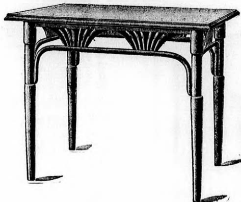
A »Royal«-szálló berendezéséből.