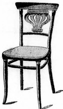
A Metropole-szálló berendezéséből.

Ajánlják dusan felszerelt raktárukat mindennemű étterem-, kávéház- és szálloda-berendezésekben.