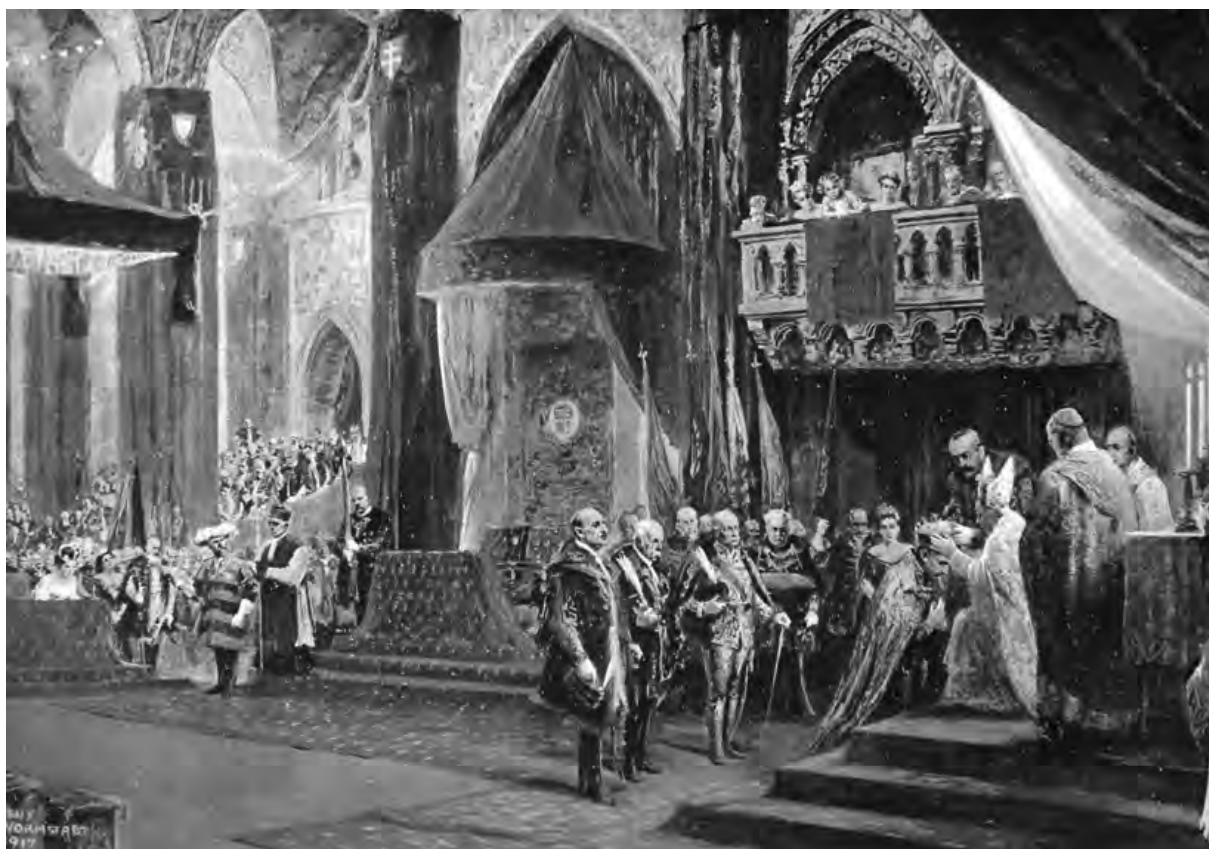
Felix Schwormstädt festménye az Illustrierte számára

Bánffy Miklós így írja le őket: „Vagy ötvenen lehettek. Csupa frontharcos tiszt. Csukaszürke egyenruhák. Kopottak. Foldozottak. Elnyűtt bőrövek, megbámult szíjak. A fáradt bakancsokon meglátszott, mennyit kéfélték erőszakosan, hogy kifényesedjenek valahogy. Az élükön mankósok, falábosak. Sántítva, kopogva, nehéz lélegzéssel. A harctér tragédiája ömlött be az ajtón, lepte el az oltár előtti térséget, hol még néhány perccel azelőtt minden csupa ragyogó csillogás volt. Néhanyan, a nyomorékbak székekre omlottak. Az épek – azok, kiket megkímélt a sors – me-rev, katonás vigyázzállásban sorakoztak. A blúza mindnek telis-teli volt vitézségi éremmel, signummal, rendjellel. Szótlanok mind. Egymással sem beszéltek, és a szemük merdő egykedvűséggel nézett maga elé. Azoknak a tekintete ez, kik nap nap után néznek farkasszemet a halállal... Valóban a Divina Comediába illő fordulat! Csak más sorrendben: A Paradiso előbb, azután az Inferno.” 13