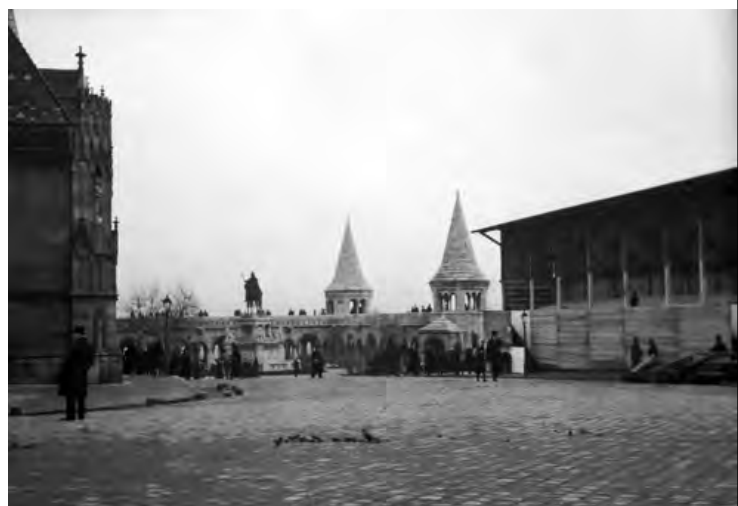
Várbeli előkészületek a koronázásra

Mindez azonban nem akadályozta meg Bánffyt abban, hogy a legkisebb részletekre is odafigyeljen és kitalálja azt a drámai fordulatot, amely során a koronázás mégiscsak