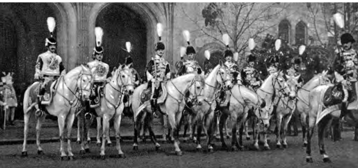
Magyar díszőrség a Mátyás-templom bejárata előtt