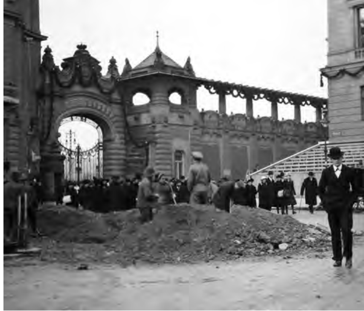
Várbeli előkészületek a koronázásra (Fortepan-felvétel)

Biztosan ismerte az 1867-es Koronázási Albumot , és talán édesapja emlékképei saját aransarkantyús lovaggá avatásával is keveredhetnek a fantáziájában, amikor a korábban méltóságteljes jelenetet szándékos ellenpontozással építette fel, és a Mátyás-templom belseje egészen ünnepi köntösbe került: „És ha a szem fölhaladt a pillérek hosszan leomló bársonyburkolásán, ha követte fölfele azokat a vaskos, függélyes ráncokat, melyek mozdulatlan hullásokban, valami óriás orgonának sípjaként vezettek a magosba, oda-fönn a csúcsos boltozás alatt széles karikában fehér tűzkörök úsztak, mint a szentek feje mögé íródó glória, az ívek áthajlását betöltve széjjelszóródó fényporokkal...”