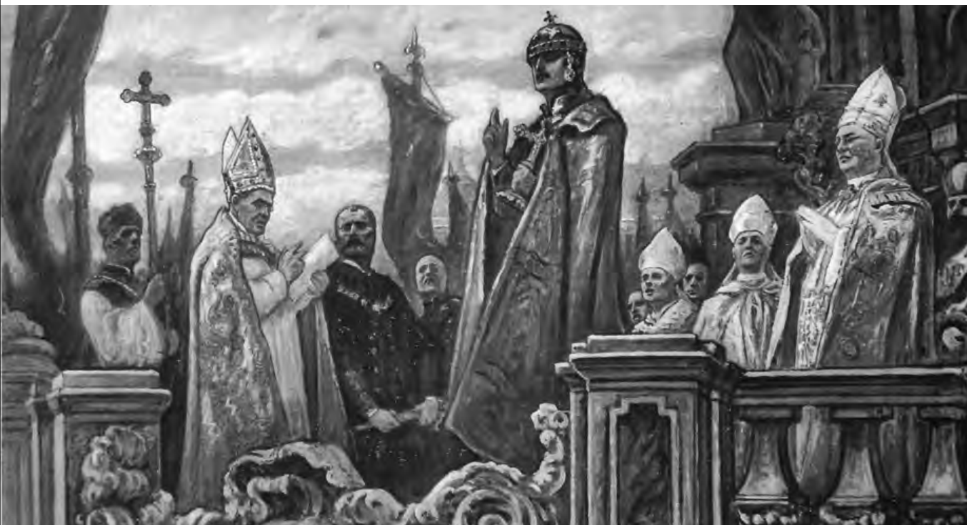
A koronázási eskütétel 1916. decembe 30-án

De nem csupán id. Bánffy Miklós vesz részt Ferenc József koronázásán, amelynek egyik legfontosabb mozzanata az aransarkantyús lovagok avatása – ez alkalommal harminc nemes urat üttettek lovaggá az alábbiak szerint: „Ő Felsege kivonta azt hüvelyéből és megérinté vele háromszor a vállát minden aransarkantyús vitéznek, kiknek sora már előbb Ő Felsege elé terjesztetett jóváhagyás végett. Az országbíró és a m. k. minister Fes-