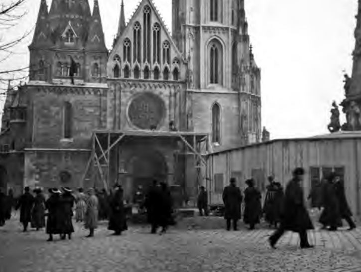
Várbeli előkészületek a koronázásra

lovasmenettel egybekötött és szabad ég alatt lefolytatandó részeiben, amelyek azonban a királyné szerepét nem érintik, miután ő a koronázási templomból visszahajtat a palotába és csak a díszbédén vesz újból részt. Azt hiszem tehát, hogy a ceremóniának a reá vonatkozó része nem fog lényegesebb változást szenvedni. A koronázás alkalmával nem kell a királynénak beszédet vagy szóbeli nyilatkozatot tennie, az 1867-i Pesti Naplóban utána nézve úgy látom, hogy általában csakis egyszer, az országgyűlés azon küldöttségének fogadása alkalmával került arra sor, amely egyenesen a királynét kérte fel, hogy magát megkoronáztassa.” 3