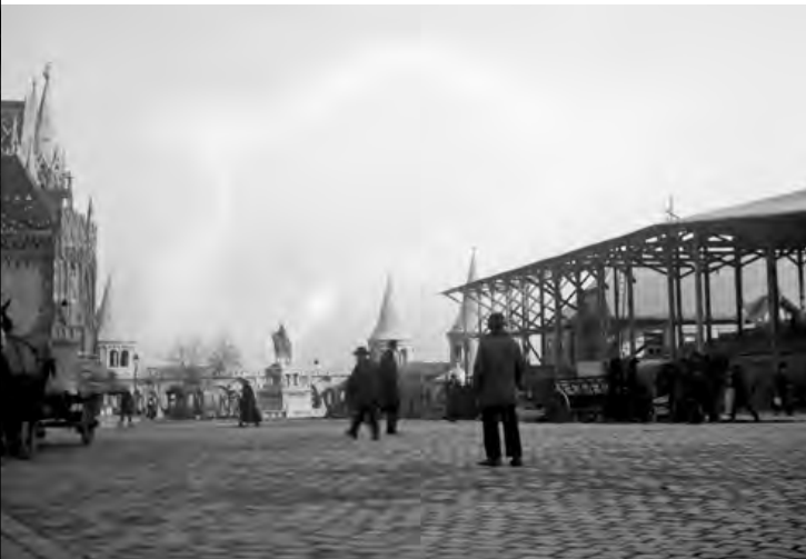
Várbeli előkészületek a koronázásra

(...) Ebben a boszorkánykonyhában én viseltem a főszakácsnak kissé komikus szerepét, ki minden fazékba belekóstol és minden tepsibe beledugja az orrát. Nem lehetett ez másként, hiszen az egész díszítésnek a felelőssége rajtam volt, és engem szidtak volna azután (mint ahogy szidtak is), ha valami nem jól sikerült. Az egész rendezésbe egysé-