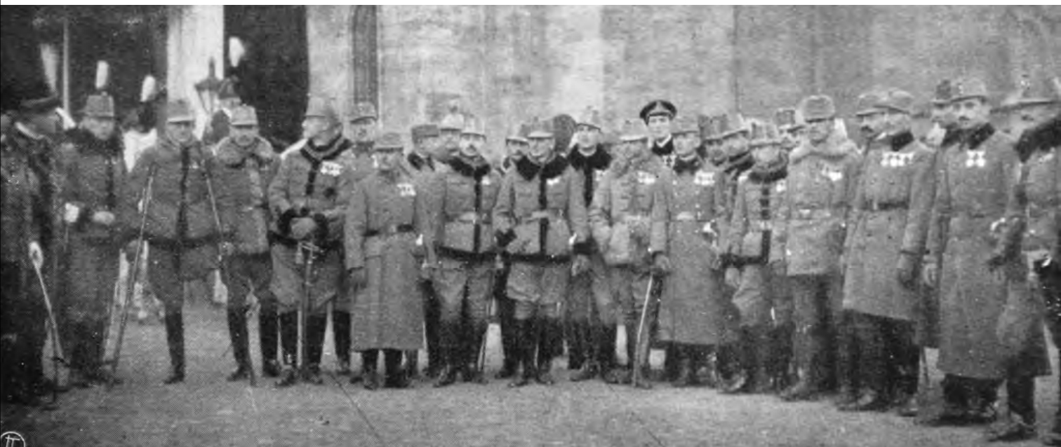
Az aransarkantyús vitézek