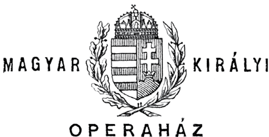
Az Operaház korabeli címere

gyakran nevezik) jórészt bálokról és hajtóvadászatokról, lakomákról és párbajokról, lóversenyekről és kártyacsatákról, szerelmekről, társadalmi ambíciókról és intrikákról ad hírt, eseményekről és cselekedetekről, amelyek – úgy tűnik – jelentős mértékben töltötték ki a felső tízezerhez tartozók életét. Egyikük-