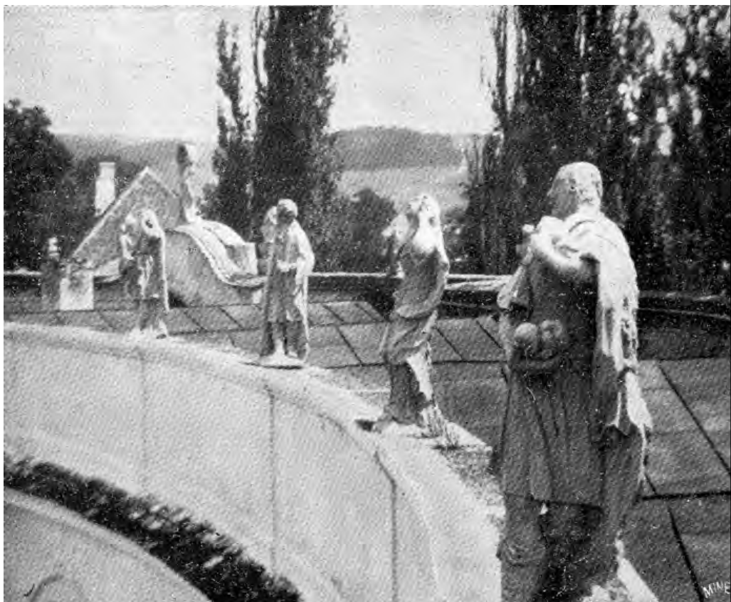
Részlet Bánffyék szoborgalériájából. A jobb szélén Ceres alakja

A „'48-asok” a politikai címke szerint ugyan radikálisok voltak, Bánffy azonban bennük