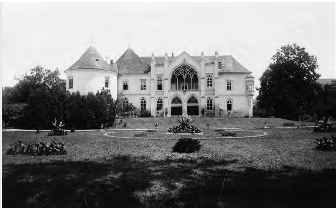
Bonchida látképe a kastélykerttel