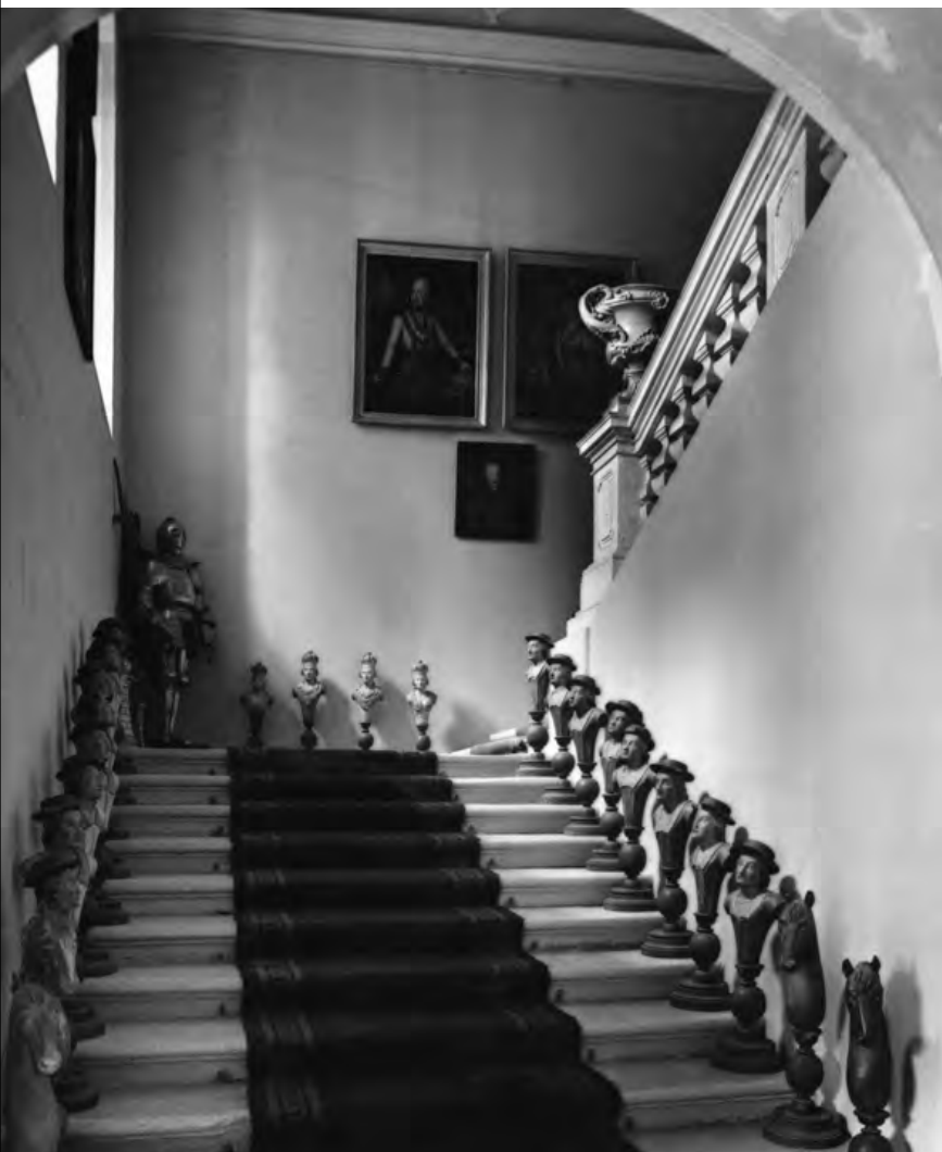
A bonchidai Bánffy-kastély, a főlépcsőház látképe a hírneves sakkfigurákkal

Az ezerarcú Bánffyhoz való közelítésben a memoáriró Bánffy nyújtotta számomra a legnagyobb segítséget. Az Emlékiratok at reflexív és önreflexív alkotásként olvastam, amelynek szerzője képes volt pontosan ér-