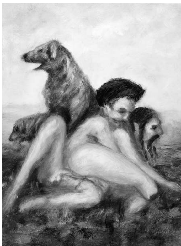
Játékos fiúk 2011 olaj, vászon, 40x30cm

ősrégi, totál elfelejtett dologról, olyan ez, tudod, mintha egy fekete lyukból előrángatná az életem egy darabját, mint utoljára, amikor arról mesélt, mennyire szerettem a tejbegrízt, most meg rá se tudok nézni, akkor meg megettem minden szomszédom tányérjáról a maradékot, mintha otthon nem kapnék enni, az óvónő meg is kérdezte a szüleit, aggódva, gyanakodva, hogy eszem-e