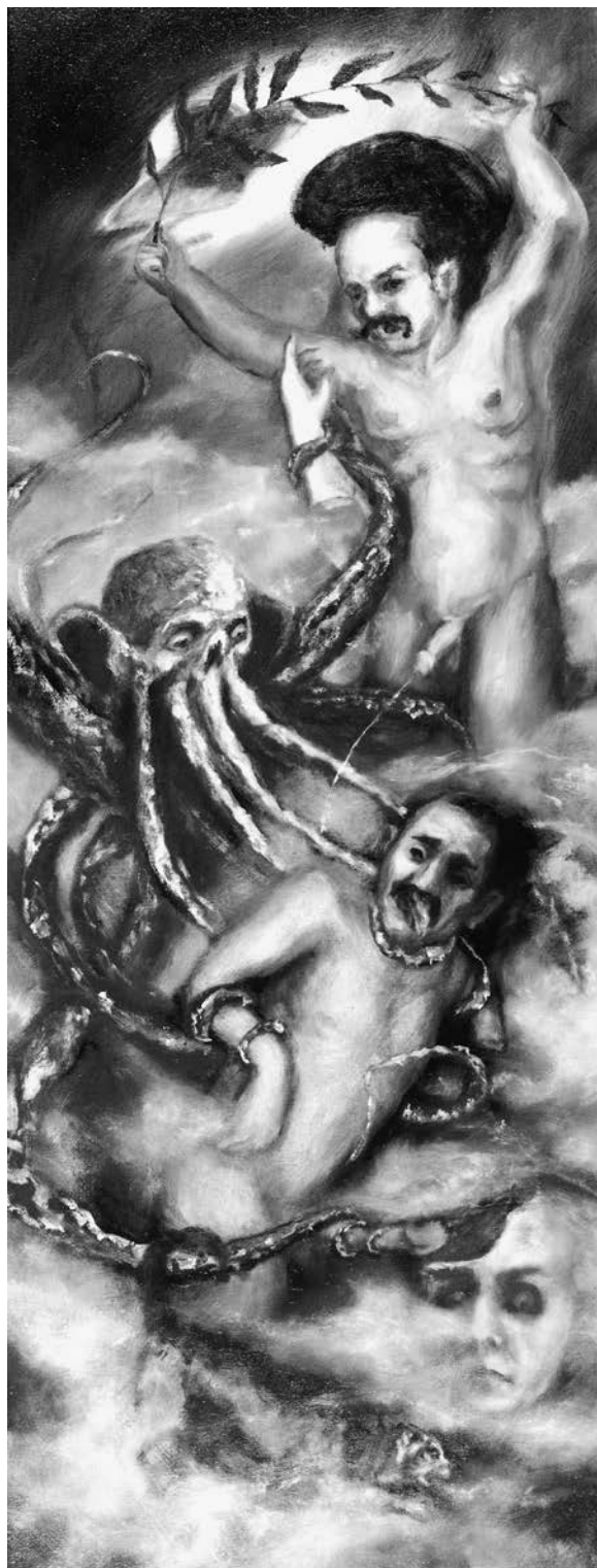
Új Hold, 2011, olaj, vászon, 160x70 cm