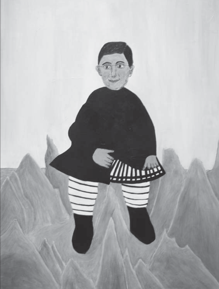
Gyurcsány Ferenc Henri Rousseau műtermében

lőcsatorna megnevezés utólagosan történt, kommunikációs okból kellett azzá kozmetikázni az eladdig sosem látott-tapasztalt alagutat a fényvel, többé hát ezt nem állítja, megmarad a lényegében közölhetetlen megtapasztalásánál – s ezt már magam teszem hozzá: visszatér hozzá, minthogy valamennyien kénytelenül visszatérünk ahhoz; e tekintetben nem is tévedünk teljesen, amikor újjászületésről beszélünk, lévén a halálunk alighanem újjá-nem-születés más néven. Nemlétünk helyreállítódása. És ezt említette meg ő is most, újra, amikor a teljesség-élményéről szólt, arról, ami ittlétünk időtartamában valamiért mindig csorbát szenved.