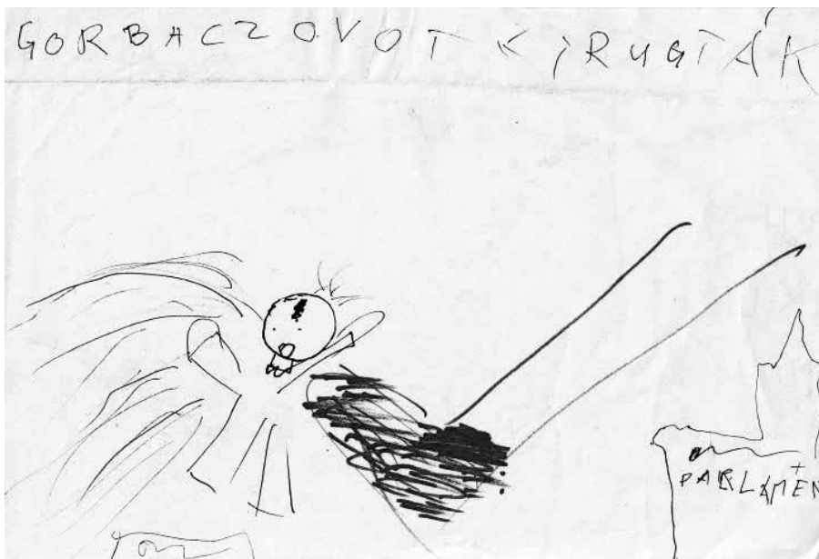
Turi Tímea: Gorbacsov (1990)