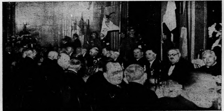
Ünnepi vacsora A főasztal előkelőségei

kedelem és ipar keresztény magyar kézben való megtartását és továbbfejlesztését tüzték ki céljukul. A Baross Szövetség nehéz időkben alakult, olyan időkben, amikor a kézben ezzel a zászlóval haladni nem jelentett sima uton járást, amikor ez a sok gond-