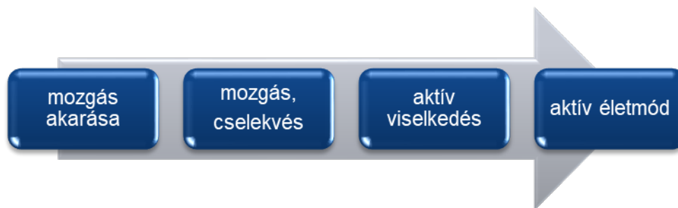
11. ábra: A konduktív nevelés céljai a hatásszervezés szempontjából

Következő lépésként feladat az aktív tanulási folyamat fenntartása, mely tanulási eredménye a mozgás, cselekedet újraszerveződése. Ehhez olyan komplex fejlesztés szükséges, melyben a holisztikus emberképből adódóan mind a mozgás, a beszéd, a kognitív funkciók, az érzelem, mind a szociális kapcsolatok egyidejű, egy személy általi fejlesztése valósul meg. Ahhoz, hogy a megtanult mozgás, cselekedet ne egy megtanult, de céltalan mozgás legyen, a mozgásszerűtnek azt az élet minden helyzetében meg kell tanulnia alkalmaznia. A megfelelő biológiai szükségletek és társadalmi elvárások biztosítása ehhez elengedhetetlen feladatnak bizonyul. Ilyen élethelyzetek lehetnek a játék, a tanulás, az óvodai élet, az iskolai élet, a munkavégzés, az önellátási tevékenységek vagy akár a szabadidő hasznos eltöltése. Ezek az élethelyzetek mindamelllett, hogy az aktív viselkedés létrejöttét támogatják, hatással vannak az ismeretek, jártasságok, készségek és képességek kialakulására is.