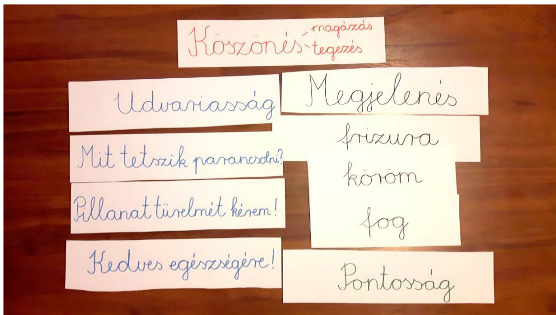
1. ábra: példa a felkészítés során alkalmazott szócsíkokra

Több alkalommal kimentünk a Caffé Sempre kávéházba, figyelve a felszolgálás folyamatait, ezzel párhuzamosan pedig egy-egy felszolgálást klubtagjainkkal átvállaltunk, erősítve feladathelyzetbe hozásukat, enyhítve szorongásaikat. Hétről hétre érezhetővé vált fejlődésük mellett, munkában való teljesíteni akarásuk.