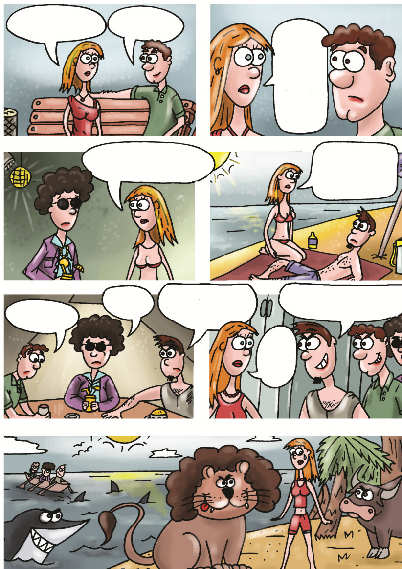
7. ábra: buborék írás. Forrás: Szalay (2014, 2. o.) Deutsch mit Comics 2. című műve

9. Buborék-írás. Szöveges képregények esetén kitöröljük a szöveget a buborékokból és a gyerekek megpróbálják a képek alapján kitalálni, ki mit mondhat az adott helyzetekben (7. ábra). Ezt a feladatot iskolai nyelvi pályázat keretében is végezhetjük.