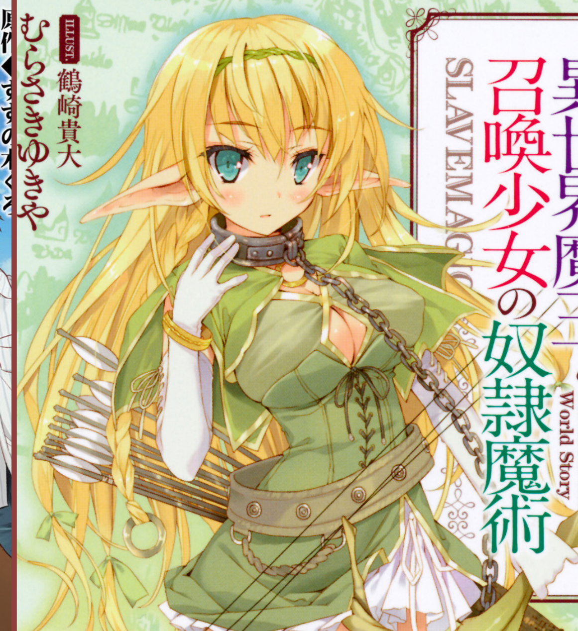
ILLUSTRATION 鶴崎貴大 むすぶのまじ